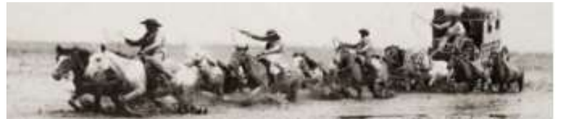
“Una epopeya comunitaria... camino a ser leyenda...”