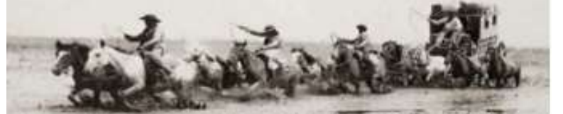
“Una epopeya comunitaria... camino a ser leyenda...”