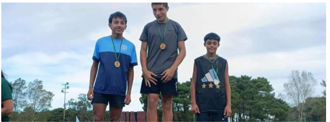
Teresita, Aguas Verdes, San Bernardo, Mar de Ajó norte y Villa Clelia.