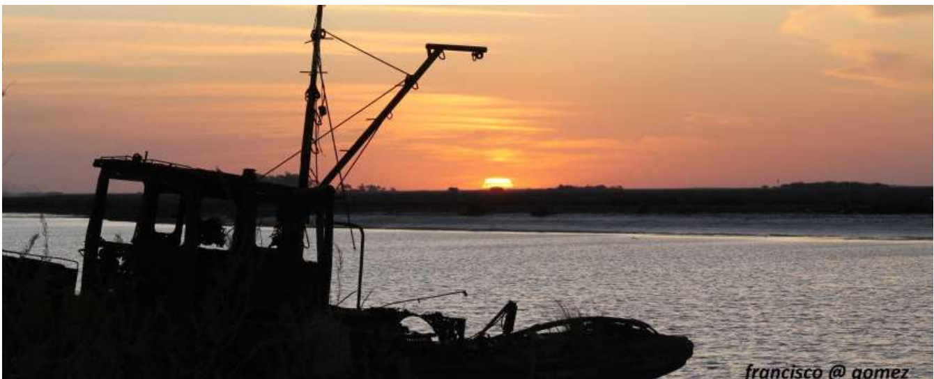
francisco @ aomez

Para más información e inscripción, las personas interesadas pueden comunicarse al 2257 580966 o acercarse a la Dirección de Turismo.