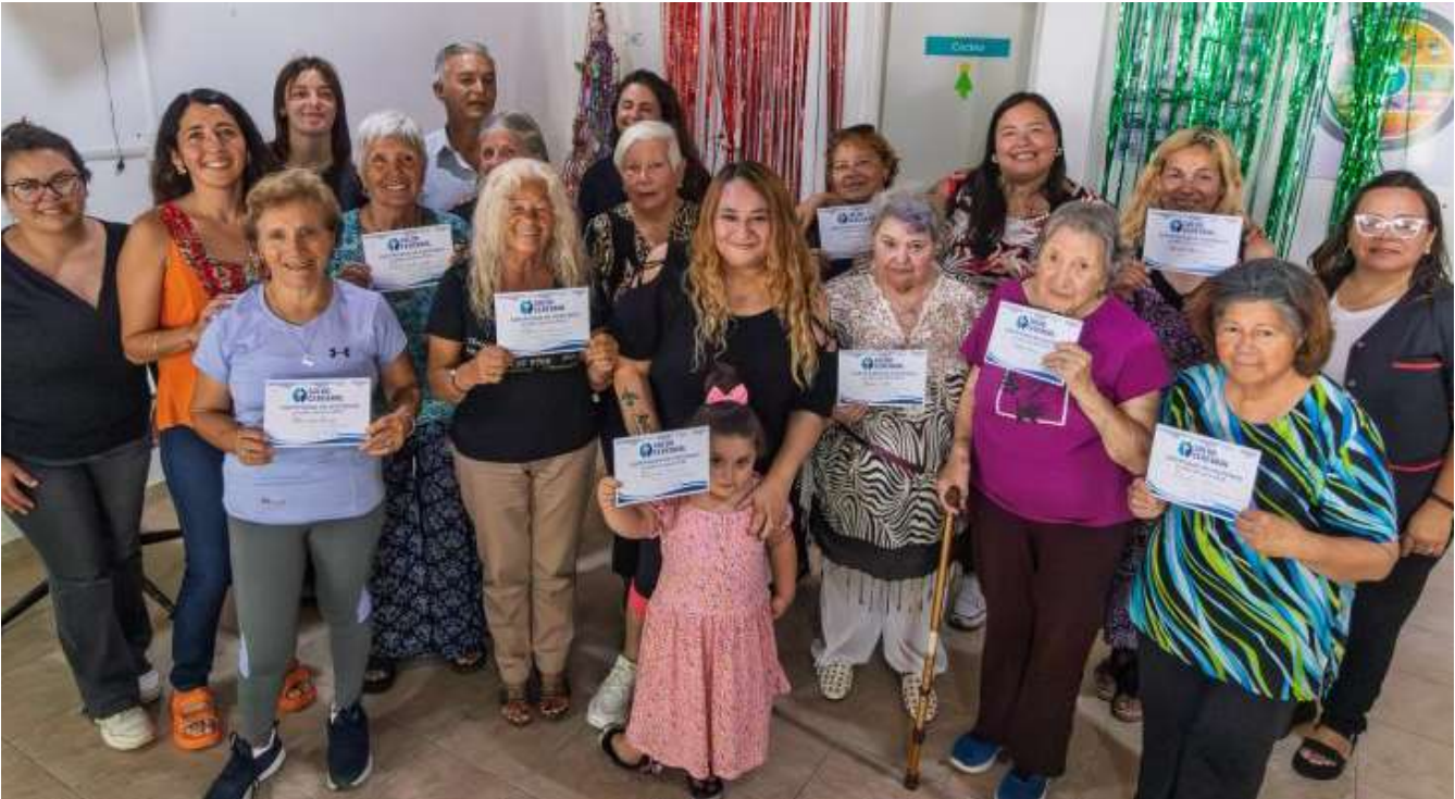
El Programa de Salud Cerebral promueve propuestas comunitarias basadas en evidencia, orientadas a la promoción de la salud cognitiva, el envejecimiento activo y el fortalecimiento de redes de cuidado en la comunidad.

El Taller de Memoria se desarrolla de manera semanal en distintos puntos del distrito. En el CAPS Parque Golf de Santa Teresita, las actividades se realizan los martes y jueves de 14.00 a 15.00. En el Centro Integrador Comunitario de Las Toninas, el taller tiene lugar los lunes de 14.00 a 15.00, mientras que en la Unidad Sanitaria de Mar del Tuyú se dicta los martes de 16.30 a 17.30.