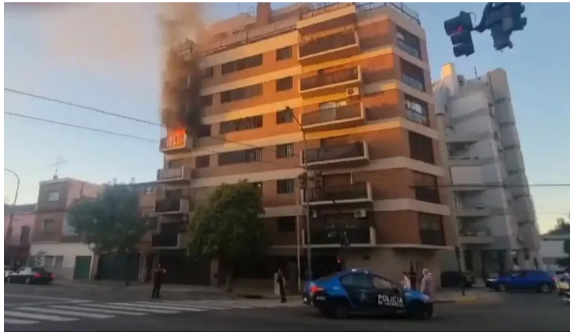
Intentó hacer un repelente casero y provocó un incendio en su departamento

El Gobierno habilitó la importación de repelentes en aerosol En medio de la escasez de repelentes, el Gobierno liberó la