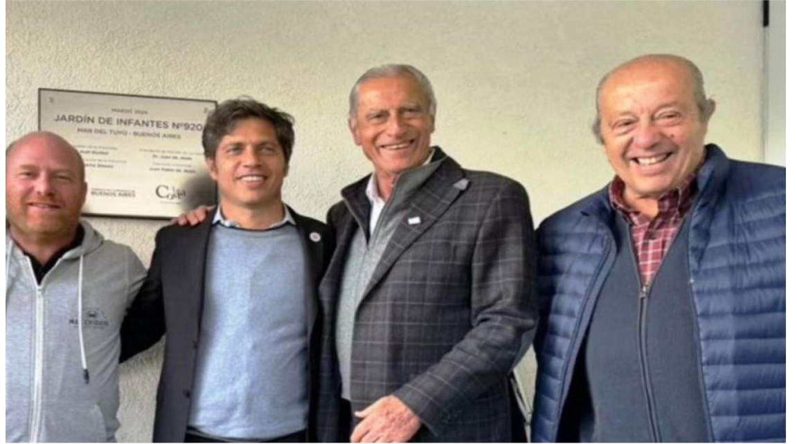
Durante el homenaje se proyectará el documental “40 años de democracia - Retrato de un líder extraordinario”.

Polideportivo de Santa Clara del Mar, ubicado en el Parque Municipal “El Diego”, este viernes a las 15:00. Como